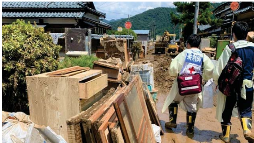
被災地の診療所とともに訪問診療を行う救護班（福井県南越前町）