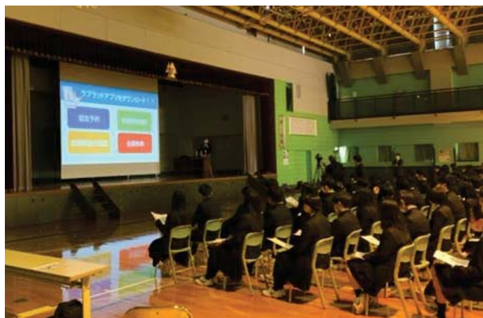
献血セミナーを受ける高校生（北海道）