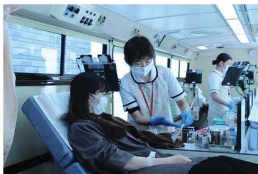
献血バスにおいて協力いただく献血者（東京都）

新型コロナウイルス感染症のまん延による、都市部を中心とした在宅勤務の普及等を背景として、従来の企業献血等の献血機会が減少したことにより、献血血液の安定確保に課題が生じました。そこで、新しい生活様式を踏まえた献血血液確保体制の確立を目指し、勤務先での団体献血経験者に対して、居住地エリアの固定施設等での献血協力に誘導していきます。