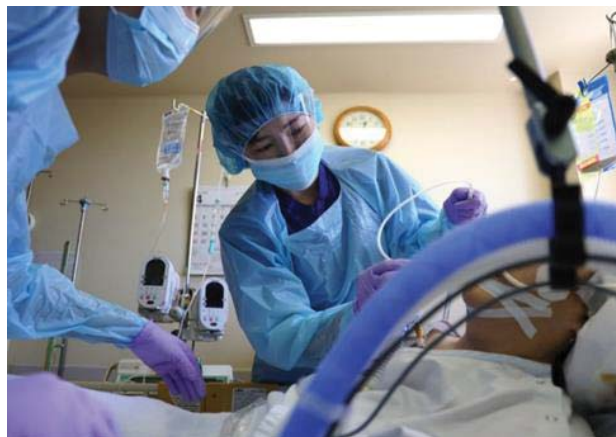
新型コロナ感染症患者の受入れ（武蔵野赤十字病院）

第二次中期事業計画においては、第一次中期事業計画に引き続き、地域において安心・安全で質の高い医療提供に努めるとともに、広く社会に貢献できる質の高い看護師の養成を目指します。