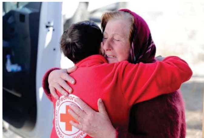
厳しい状況に苦しむ女性を元気づけるウクライナ赤十字社ボランティア

ウクライナ人道危機の救援～復興にかかる戦略策定と各フェーズの支援に的確な対応を図るとともに、その陰で国際社会の関心や支援が十分に届いていない人道危機（食料危機、人口移動、気候災害など）に対しても、持てる資源をもって最大限の対応を図ります。