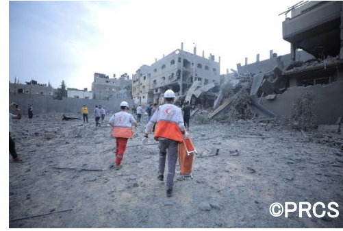
イスラエル・ガザ人道危機において負傷者の救援に向かうパレスチナ赤新月社のスタッフ