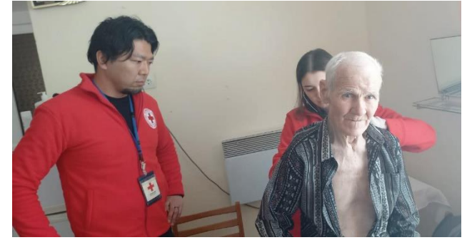
ウクライナ人道危機において診療に立ち会う日赤スタッフ(左)