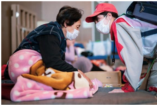
令和6年能登半島地震における避難所巡回診療