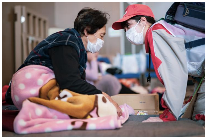
「避難所で巡回診療を行う救護班 (石川県七尾市)」