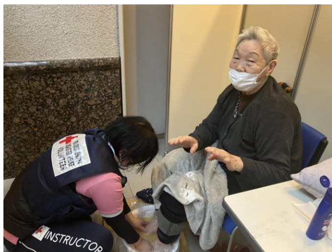
「被災者支援としてリラクゼーションを行う 赤十字ボランティア(石川県七尾市)」