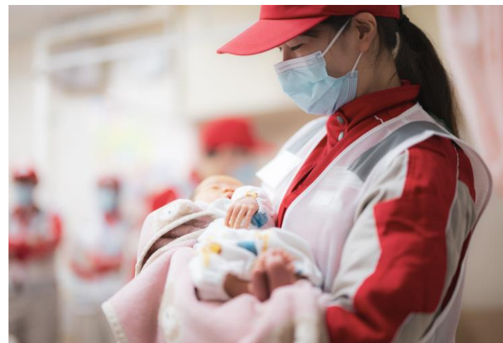
「避難所で赤ちゃんを抱っこする救護班 (石川県輪島市)」