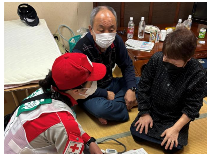
「被災者の声に耳を傾けるところのケア班 (石川県志賀町)」