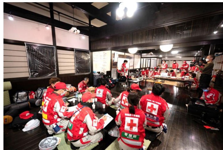
「活動方針についてミーティングをする救護班 (石川県輪島市)」