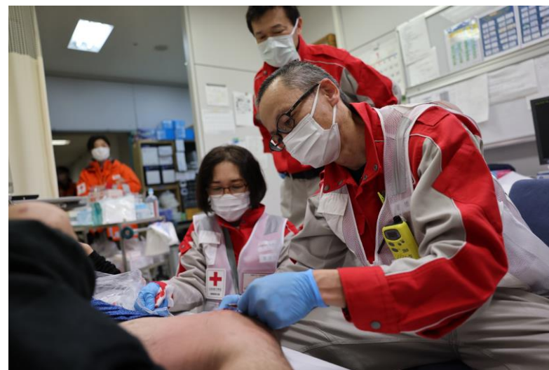
「救護所で被災者の手当を行う救護班 (石川県珠洲市)」