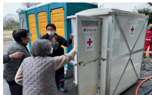
「設備の使用方法を説明する日赤職員(石川県七尾市)」