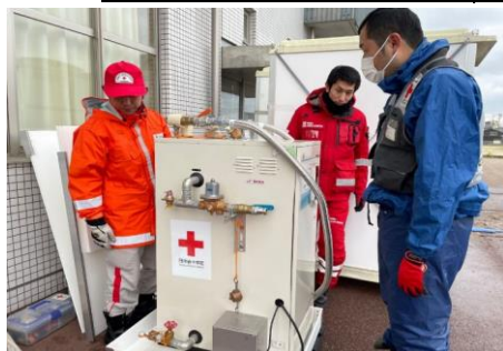
「給水支援の資機材を設置する日赤職員(石川県七尾市)」