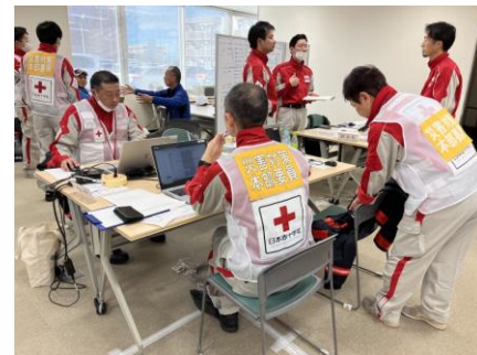
「石川県支部災対本部で業務を行う日赤職員(石川県金沢市)」