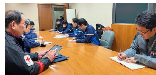
「石川県庁での打合せに参加する日赤医師(石川県金沢市)」 19