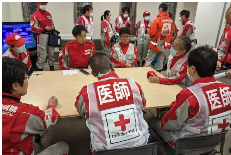
「石川県支部でブリーフィングを受ける救護班 (石川県金沢市)」