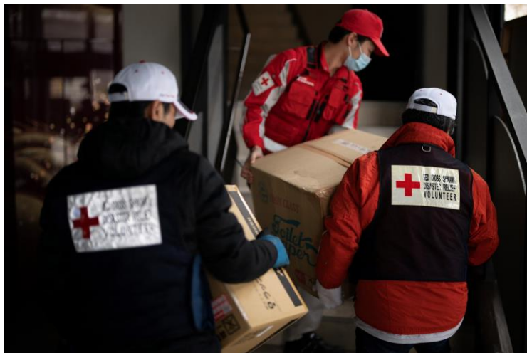
「物資を運搬する赤十字ボランティアと救護班(石川県輪島市)」