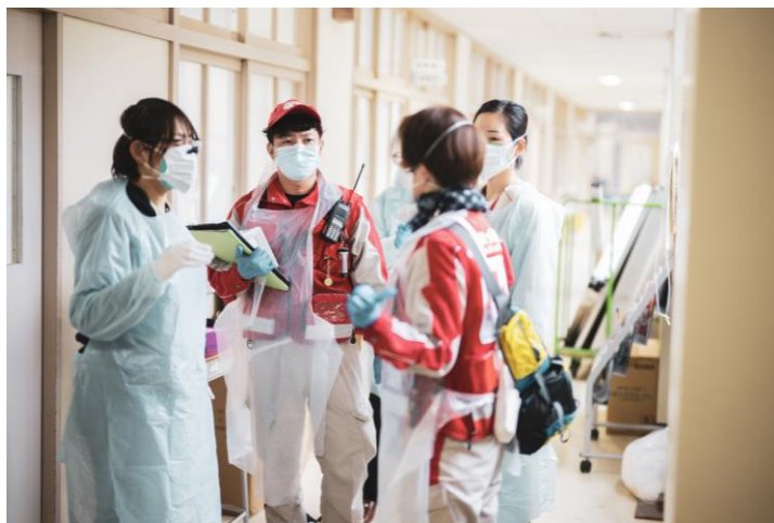
「感染対策をしながら避難所で巡回診療を行う 救護班(石川県輪島市)」