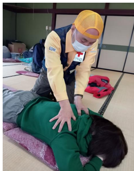
「救護班に帯同し被災者 支援活動を行う群馬県接 骨師赤十字奉仕団(石川 県珠洲市)」