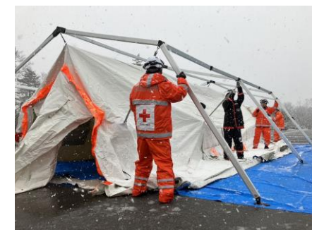
「救護員宿泊用のテントを設営する日赤職員(石川県珠洲市)」